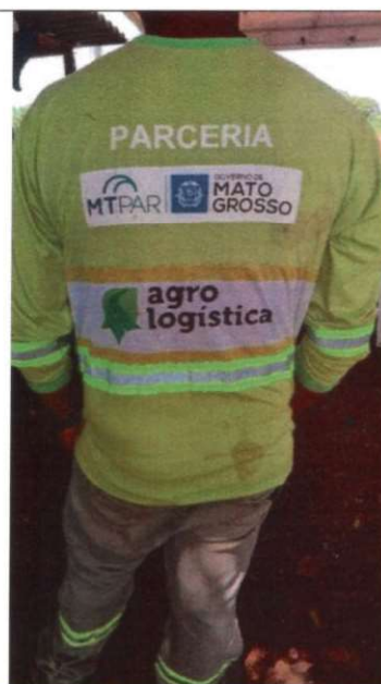
Exemplo Modelo: Calça de brim pesado e camiseta malha pv manga longa