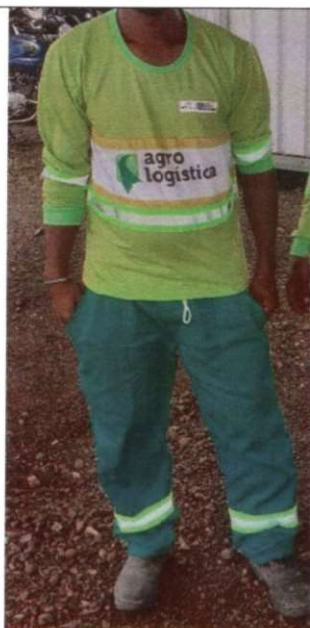
Exemplo Modelo: Calça de brim pesado e camiseta malha pv manga longa