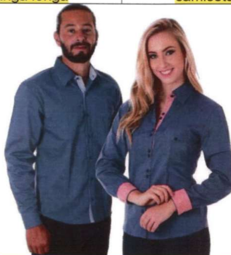
Exemplo Modelo: camisa social masculina; tricoline manga longa; colarinho combinada

Exigências: Para que o orçamento da sua empresa participe da Cotação Prévia de Preços , é necessário que o mesmo contenha os seguintes itens: